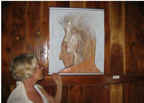
Kevään 2009 kurssin yhteydessä pidettiin näyttely